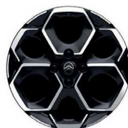
Hliníkový disk ATACAMITE 17" - diamantée