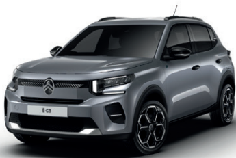
Šedá MERCURY (M)