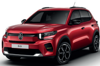
Červená ELIXIR (M)