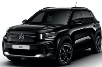
Černá PERLA NERA (M)