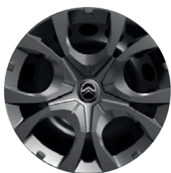
Okrasný kryt PYRITE 16"