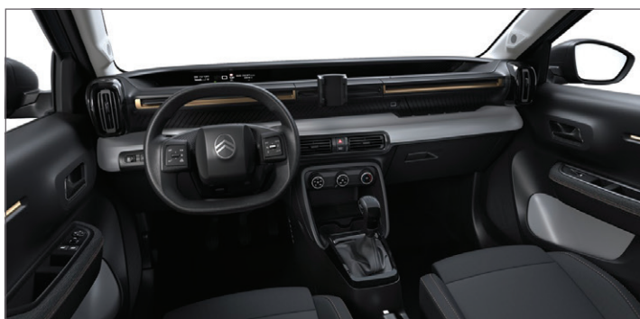
YOU: LÁTKA ČERNÁ / LÁTKA QUADRIC