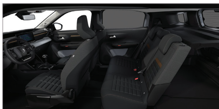
SEDADLA ADVANCED COMFORT®