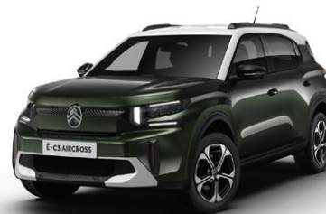
Zelená MONTANA (M)