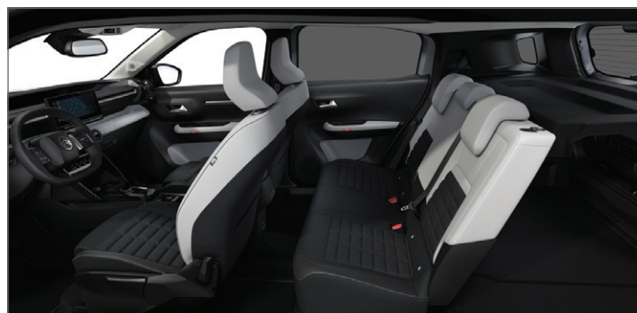
SEDADLA ADVANCED COMFORT®