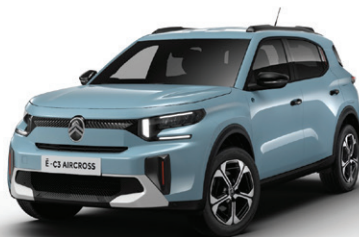
Modrá MONTE CARLO (N)