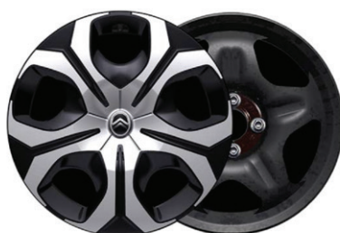
Okrasný kryt SYLVANITE 17"