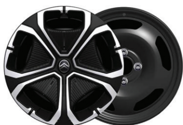
Okrasný kryt TITANITE 16"