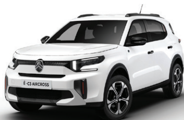
Bílá BANQUISE (N)