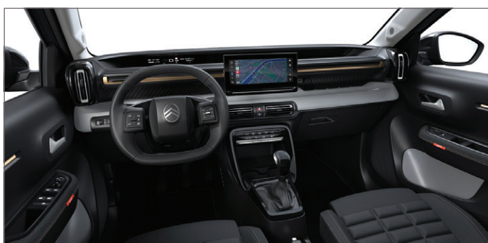
PLUS: LÁTKA ČERNÁ / LÁTKA QUADRIC