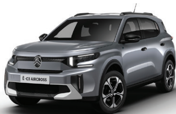
Šedá MERCURY (M)