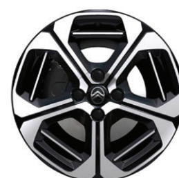
Hliníkový disk ARAGONITE 17" - s výbrusem