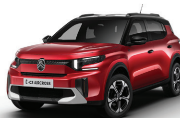
Červená ELIXIR (M)