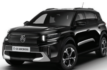
Černá PERLA NERA (M)